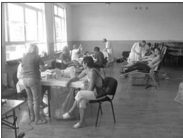
Akcja oddawania krwi w zarzeckiej remizie OSP

W imieniu klubu i wszystkich tych, którzy potrzebowali naszej krwi za okazane serce dziękujemy. Mamy nadzieję, że podczas kolejnej akcji, która się odbędzie jeszcze w tym roku tj. 15 września nie zabraknie również chętnych do dzielenia się tym najcenniejszym skarbem, jakim jest nasza krew.