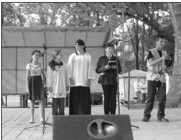
Występ grupy młodzieżowej z Pełnatycz

bardzo rozbawiających i mocno oklaskiwanych przez biesiadników.