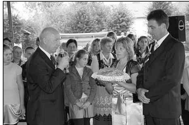
Przekazanie chleba Wójtowi Gminy Zarzecze