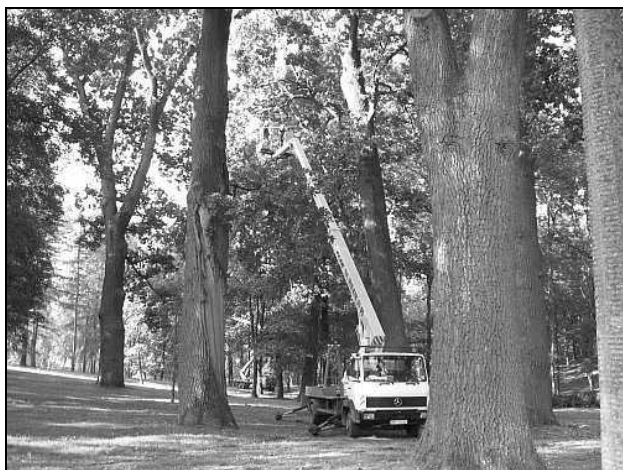
Prace konserwacyjne w zarzeckim parku

Całość prac prowadzona jest pod ścisłym nadzorem Wojewódzkiego Konserwatora Przyrody. W ramach Regionalnego Programu Operacyjnego Województwa Podkarpackiego na lata 2007 - 2013 otrzymaliśmy dofinansowanie w wysokości 3 mln zł na rewitalizację zabytkowego parku w Zarzeczcu. Całkowita wartość zadania to kwota 3.597 tys. zł. Udział własny gminy to 597 tys. zł. Planowany termin realizacji - do końca kwietnia 2011 r. Inwestycja zlokalizowana będzie na terenie istniejącego parku w Zarzeczcu o powierzchni 7,55 ha stanowiącej własność gminy Zarzecze.