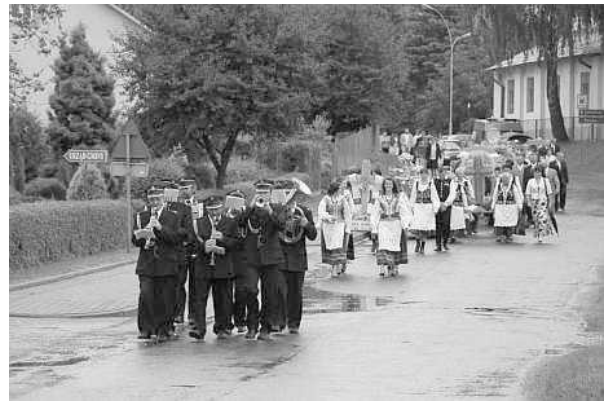
Korowód dożynkowy powracający z Mszy św.

Dzieci i młodzież pięknie zatańczyły taniec irlandzki, cha-chę, walca oraz zaśpiewały piosenkę o żalu za przemijającymi pięknymi tradycjami kultury ludowej.