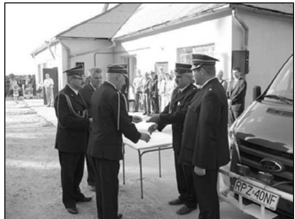
Przekazanie kluczy i dowodu rejestracyjnego