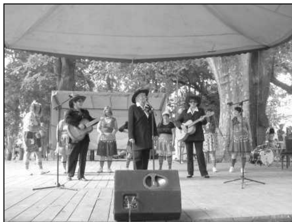
Występ Kabaretu z Kisielowa

Wszystkie nagrody pieniężne ufundowało Centrum Kultury w Zarzeczcu.