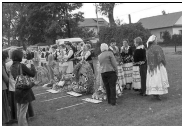
Delegacje z wieńcami z naszej gminy