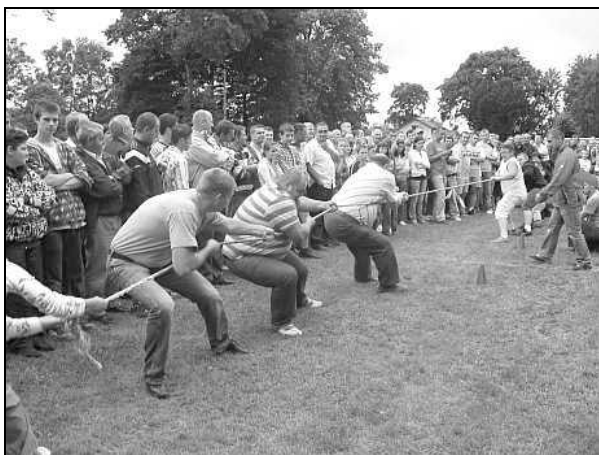
Konkurencja przeciągania liny

W ramach Gminnego Święta Sportu, tradycyjnie, rozegrano turniej piłki nożnej o puchar Wójta Gminy Zarzecze, turniej siatkówki o puchar Przewodniczącego Rady Gminy Zarzecze oraz dyscypliny lekkoatletyczne i rekreacyjne. Liczne konkurencje sportowe przyciągnęły duże grono zawodników. Wykazać się mogli zarówno mężczyźni jak i kobiety.