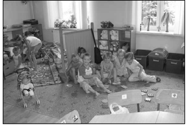
Nowy oddział przedszkolny w Kisielowie

Nad prawidłową realizacją i rozliczeniem przyznanych środków czuwa zespół zarządzający. Szczegółowych informacji uzyskać można w biurze projektu - budynek Banku Spółdzielczego w Zarzeczcu.