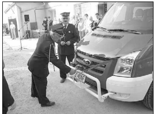
Przecięcie wstęgi przez Prezesa OSP w Siennowie