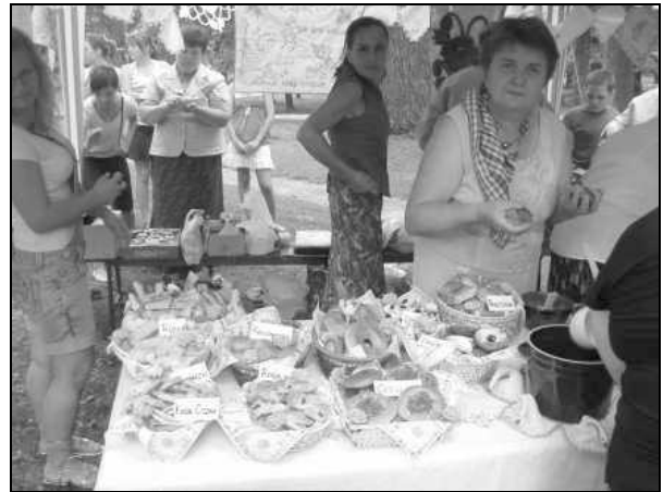
Stoisko KGW z Roźniatowa

Stwierdzamy ponadto, że Biesiada - Konkurs był dobrze przygotowany. Tą drogą chcemy podziękować organizatorom za sprawne przeprowadzenie prezentacji konkursowych, a uczestnikom za wyrównany poziom występów artystycznych, piękne stoły oraz bardzo smaczne potrawy.