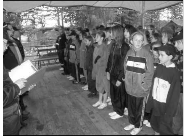
Ogłoszenie wyników i wręczenie nagród