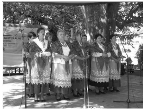
Występ Zespołu Śpiewaczego z Maćkówki

W kategorii dzieci i młodzież jury przyznało dwie równorzędne I-sze nagrody: Młodzieżowemu Zespołowi Śpiewaczemu „Stokrotki” z Cewkowej Woli oraz Zespołowi „Orzechowiaczy” z Orzechowic. Ponadto przyznano 2 wyróżnienia: Młodzieżowemu Zespołowi Śpiewaczemu z Łapajówki oraz Zespołowi Śpiewaczemu ze Szkoły Podstawowej w Zarzeczcu.