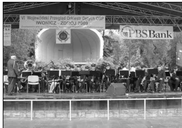
Występ zarzeckiej orkiestry w Iwoniczu

Do tego pięknego kurortu przyjechało 14 najlepszych, wybranych spośród wszystkich strażackich orkiestr dętych działających na terenie województwa podkarpackiego. W planie imprezy był przewidziany przemarsz wszystkich orkiestr oraz występ na scenie, jednakże padający deszcz uniemożliwił zorganizowanie przemarszu i dziewczęta z grupy mażorettek nie mogły zaprezentować swoich umiejętności.