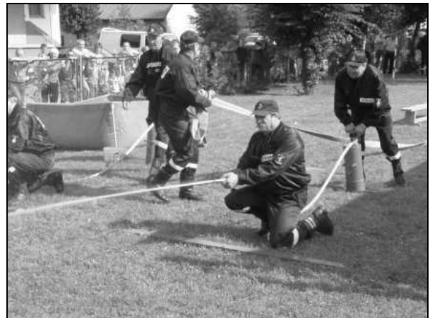
Rozwinięcie bojowe na ostro

zainteresowaniem zwłaszcza wśród najmłodszych cieszyły się przejazdy bryczką.