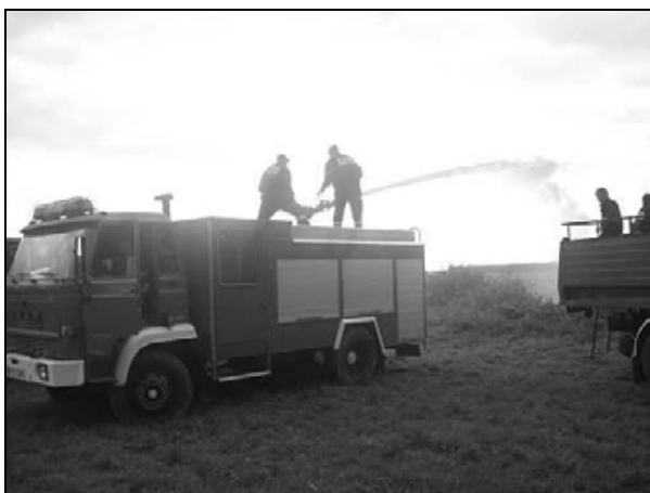
Akcja gaszenia sadu

Teoretycznym zadaniem, jakie strażacy otrzymali do wykonania było ugaszenie pożaru parku i sadów w Siennowie. W praktyce, wykonali pracę polegającą na spalaniu, w kontrolowany sposób, gałęzi pozostałych po pracach pielęgnacyjnych w parku.