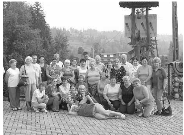
Uczestnicy warsztatów w Poroninie

Uczestnicy zadowoleni, niektórzy byli pierwszy raz w stolicy Tatr i w jej okolicach, pełni wrażeń wrócili szczęśliwie do domów.