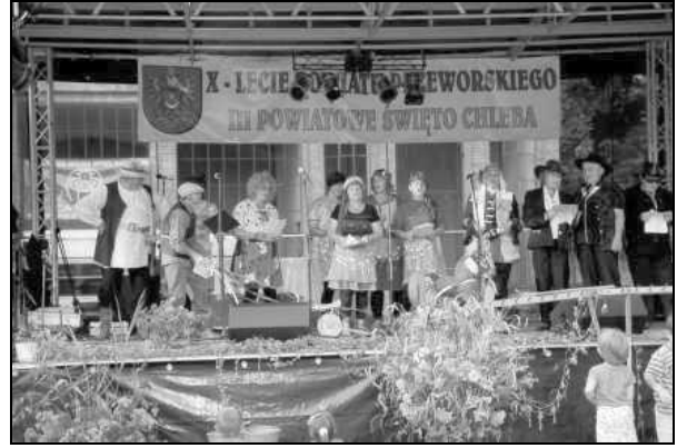
Występ KGW z Kisielowa

Obok prezentacji potraw Koła Gospodyń miały możliwość występu na scenie i zaprezentowania swoich umiejętności estradowych. Duży aplauz publiczności zdobył występ Pań z Koła Gospodyń w Kisielowie. Panie przebrały się w kolorowe peruki śpiewały, tańczyły, a jedna nawet w stroju rolnika pociągała za lejce konia na biegunach. Występ Pań z Kisielowa zakończył III Powiatowe Święto Chleba.