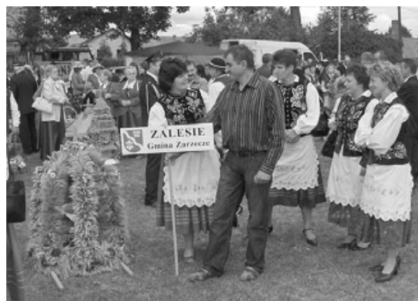
Wyróżniony wieńiec z Zalesia

Mieliśmy nadzieję, że posłuchamy zespołu disco polo "Skalar", ale ich koncert opóźniał się przeszło 2 godziny, więc zdecydowaliśmy o powrocie do domu. Piękna, przyjazna i miła atmosfera, która panowała w czasie podróży, jak i przez cały pobyt w Radomyślu, napawa optymizmem i pozwala stwierdzić, że naszym społecznikom wspaniale służą takie wyjazdy integracyjne.