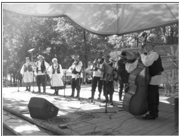
Gwiazda XI Przeglądu - Graboszczanie

Fundatorami nagród byli: Centrum Kultury w Zarzeczcu, Centrum Kulturalne w Przemyślu oraz Podkarpacka Izba Rolnicza w Boguchwale. Imprezę sponsorowała Firma BaMał z Pełnaticz. Ponadto odbył się kiermasz rękodzieła ludowego, a atrakcji nie zabrakło dla nikogo.