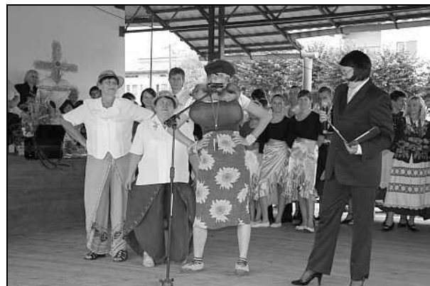
Występ kabaretu KGW Zarzecze