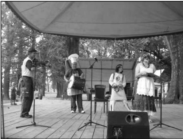
Występ Międzynarodowego Kabaretu