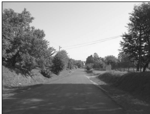
Nowa nawierzchnia drogi powiatowej - Siennów

Wykonawcą całości robót w wyniku rozstrzygniętego przetargu jest Przedsiębiorstwo Budowy Dróg i Mostów – Józef Babiś w Roźwienicy. Planowane zakończenie robót łącznie z chodnikami i nawierzchnią asfaltową na terenie miasta Przeworska planowane jest na koniec kwietnia 2010 r.