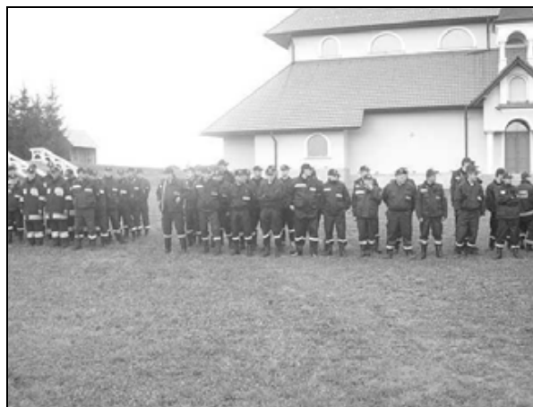
Zbiórka jednostek pod kościołem w Siennowie

Po wykonaniu zadań bojowych, reprezentacje gmin oraz drużyna skompletowana z Prezesów i Naczelników OSP, rozegrały turniej piłki nożnej. Turniej odbył się na boisku sportowym klubu „Wiselka” Siennów.