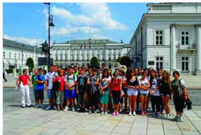
Pamiętkowe zdjęcie przed Belwederem w Warszawie

Celem zajęć z terapii pedagogicznej było zapewnienie przewycięzania trudności w nauce spowodowanych przez różne nieprawidłowości i dysfunkcje rozwojowe u 15 uczniów Zespołu Szkół w Żurawiczkach.