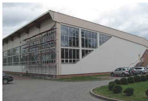
Remont elewacji hali sportowej w Zarzechu

Kolejnym zadaniem realizowanym przez pracowników gospodarczych Urzędu Gminy jest remont elewacji hali sportowej w Zarzechu.