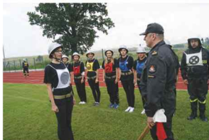
Drużyna żeńska z Zarzeczca gotowa do rozgrywek

Natomiast w grupie B (żeńskie) zwyciężyli: I miejsce - GAĆ, II miejsce - ZARZECZE, III miejsce - Sietesz.