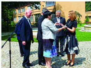
Uroczyste przekazanie kluczy

Następnie uroczystym obiadem rozpoczęło się biesiadowanie oraz tańce to późnych godzin nocnych.