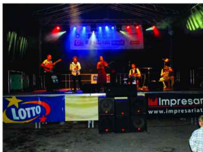
Gwiazda wieczoru – zespół Tygiel Folk Banda

Na estradzie wystąpił również trzeci zespół Tygiel Folk Banda prezentujący własne spojrzenie na muzykę cygańską, żydowską, turecką i rumuńską z elementami swingu i flamenco.