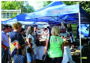
Degustacja tradycyjnego chleba i proziaków

też mogły postrzelać na strzelnicy, z czego korzystali również dorośli. Swoje stoiska rozłożyli również mali rzemieślnicy produkujący miód, lody, czy wate cukrową.