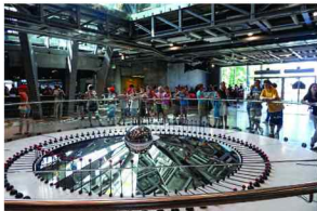
W Centrum Kopernik

samodzielnego rozwiązywania problemów. Zdobycie nowych doświadczeń z pewnością zapoczątkuje w przyszłości.