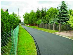
Droga w Zarzeczcu w trakcie budowy

W miesiącu styczniu wyłoniono w drodze przetargu dostawę kruszywa w ilości 190 m 3 do remontu dróg gminnych gruntowych. Wyboru dróg do remontu dokonały Rady Sołeckie poszczególnych wsi. Wykonane zostały również remonty cząstkowe dróg przy użyciu remonterów w miejscowościach Zalesie, Siennów, Łapajówka, Zarzeczce, Kisielów. W sierpniu oddano do użytkowania dwa odcinki dróg gminnych o nawierzchniach bitumicznych, tj. w Mackówce „Zadwór” na odcinku 290m oraz w Zarzeczcu k/Mleczarni na odcinku 135 m.