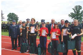
Nagrodzone drużyny żeńskie

Organizatorami zawodów był Zarząd Oddziału Powiatowego ZOSP w Przeworsku, Komendant Powiatowy PSP w Przeworsku oraz OSP Zarzeczce.