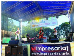
Koncert zespołu Podoba Mi Się

Pierwszy zespół, który wystąpił na zarzeckiej scenie to ukraiński Lars Reller Band. Goście przedstawili godzinny program, w trakcie którego zagrali swoje ukraińskie przeboje, a dla nas zaskoczeniem było wykonanie kilku polskich utworów. Następny zespół, który przedstawił się zarzeckiej publiczności to Podoba mi się, czyli finaliści I edycji polskiej edycji programu „Must Be the Music. Tylko muzyka”.