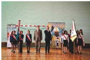
Inauguracja roku szkolnego w Zarzeczcu

W wyniku Uchwały Rady Gminy Zarzecki od 1 września 2013 r. Zespół Szkół w Zarzeczcu składa się ze Szkoły Filialnej im. Orła Białego w Pełnatyczach, Szkoły Filialnej im. Stefana Kardynała Wyszyńskiego w Roźniatowie, Szkoły Podstawowej im. Jana Pawła II w Zarzeczcu oraz Publicznego Gimnazjum im. Jana Pawła II w Zarzeczcu.