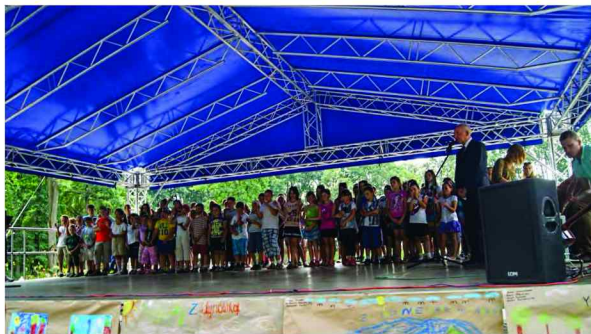
Zakończenie Półkolonii w Zarzeczcu