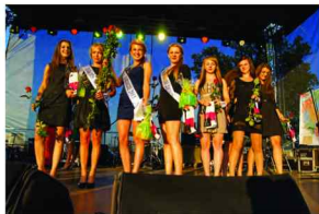
Dziewczyny biorące udział w konkursie