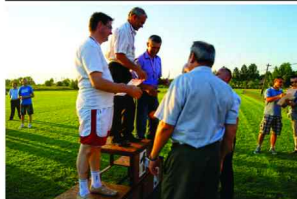
Dekoracja najlepszych sołtysów