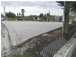
Parking w Żurawiczkach w trakcie budowy

W lipcu rozpoczęto roboty przy budowie miejsc postojowych dla samochodów osobowych w miejscowości Żurawiczki (koło kościoła). W ramach inwestycji wykonano rów kryty w formie kolektora burzowego \varnothing 400mm na odcinku 60 mb z systemem przelotowych studni rewizyjnych oraz nawierzchnię płyty parkingu z betonowej kostki brukowej o pow. 450 m 2 . Inwestycja o wartości 40 tys. złotych zostanie zakończona pod koniec września.