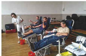
Mieszkańcy naszej gminy w trakcie oddawania krwi

Wyniki przerosły nasze oczekiwania. Po raz kolejny okazało się, że na mieszkańców Gminy Zarzecki oraz gmin sąsiednich można liczyć. O godz. 9.00 korytarz przed salą narad w Remizie OSP w Zarzeczcu wypełnił się chętnymi do oddania tego drogiego leku.