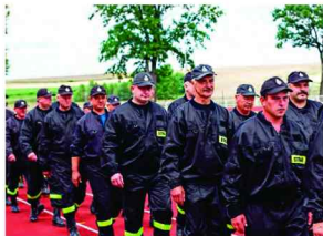
Zbiórka strażaków weteranów

Imprezę rozpoczęły zawody strażaków weteranów (sztafeta - tor przeszkód przy użyciu sikawki konnej; rozwinięcie bojowe; musztra). Z terenu Gminy Zarzeche wzięło udział 8 drużyn strażaków weteranów z Łapajówki, Maćkówki, Pełnatycz, Roźniatowa, Siennowa, Zalesia, Zarzecha i Żurawiczek oraz drużyny z Cieszacina Wielkiego i Kańczugi. Zwycięzcami zawodów zostały drużyny: I miejsce - Cieszacin Wielki, II miejsce - Kańczuga, III miejsce - Pełnatycze.