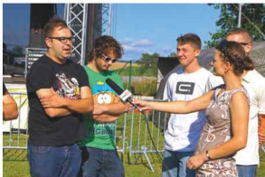
Le Moor w trakcie wywiadu dla Twojej TV

W następnej kolejności wystąpił kolbuszowski zespół „Le Moor” grający muzykę rockową od 8 lat. Charyzmatyczny występ zespołu wprowadził publiczność w niepowtarzalny rockowy klimat. Udział w imprezie na pewno przysporzył muzykom nowych sympatyków, którzy swoją energię i zadowolenia wyrazili poprzez liczne bisy i głośne brawa.