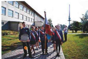
Przejęcie pocztu sztandarowego

Szkoły bł. Jana Pawła II, gdzie odśpiewano hymn państwowy oraz „Barwę”.