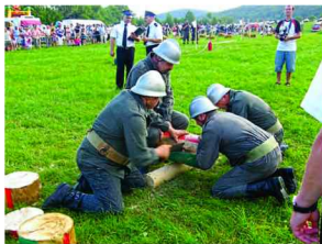
Jednostka OSP Zarzeche w trakcie zawodów

Impreza rozpoczęła się prezentacją zaprzęgów konnych, następnie odbyły się zawody sprawnościowe dla drużyn, a na zakończenie, wszystkie jednostki konne brały udział w gaszeniu pożaru.