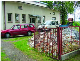
Budynek Środowiskowego Domu Samopomocy w Zalesiu