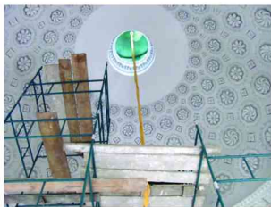
Prace konserwatorskie w zarzeckim pałacu

Na liście remontów obiektów gminnych znalazły się również budynki zabytkowe. Aktualnie trwają prace renowacyjno-konserwatorskie Salonu Okrągłego w Zespole Parkowo-Pałacowym w Zarzeczcu. Zadanie zostało podzielone na dwa etapy: konserwacja czaszy kopuły wraz z rekonstrukcją polichromii latarni oraz rekonstrukcję detali sztukatorskich i stiuków na ścianach wewnętrznych. Prace te zostały dofinansowane w kwocie 40 tys. zł w ramach ochrony zabytków nieruchomości przez Wojewódzkiego Konserwatora Zabytków oraz w kwocie 70 tys. zł. przez Ministra Kultury i Dziedzictwa Narodowego. Do w/w zadania gmina Zarzece dodała 12 tys. zł.