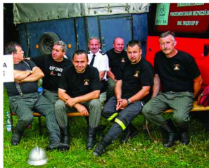
Jednostka OSP z Zarzeczca po zakończeniu zawodów

W czasie imprezy w Rudawce Rymanowskiej odbyły się również zawody drwali dla pracowników zakładów usług leśnych oraz konkursy dla Kół Gospodyń Wiejskich.