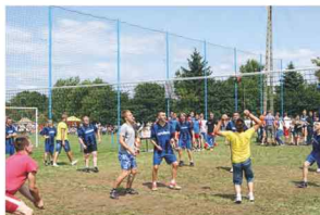
Mecz piłki siatkowej