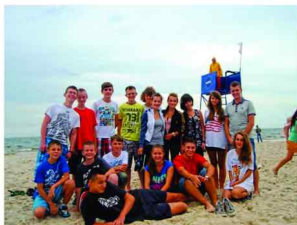
Pamiętkowe zdjęcie z nad morza

przygotowały uczestników do zawodów sportowych „Olimpiada Kolorów” oraz do Kolonijnego Konkursu Plastycznego. Nasi młodzi koloniści mogli również prezentować swoje umiejętności i talenty na wieczorku karaoke oraz wieczorku twórczości „MAM TALENT”. Nie brakło też wzruszeń, radości, uśmiechu oraz otwartości na innych. Nie brakło śpiewu przy wieczornym ognisku, gdzie posilaliśmy się kielbaską i dzieliliśmy się naszymi wrażeniami i wspomnieniami. Tradycyjne wybory miss i mistera kolonii, wieczorki filmowe, dyskoteki oraz spacer po plaży połączone z podziwianiem zachodu słońca - te chwile już na zawsze wszyscy zapamiętamy. Dodatkowo powstał „Kolonijny Klub Biegacza”, w którym pod okiem wychowawców-wufefistów - koloniści rozwijali się również fizycznie oraz uczyli się dbać o własne ciało, bo przecież „w zdrowym ciele, zdrowy duch”.