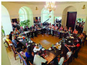
Uczestnicy spotkania w zarzeckim pałacu

Tematem spotkania m. in.: było zapoznanie gości z historią pałacu, jego statusem oraz możliwościami rozwoju. Grupa była zauroczona ciepłym przyjęciem i pięknym zespołu pałacowo - parkowego, dlatego postanowiła uczestniczyć także w Biesiadzie z radiem WAWA w dniu następnym.