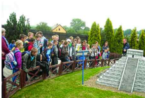
Wycieczka do Inwaldu

Dodatkowo w ramach realizacji Gminnego Programu Profilaktyki i Rozwiązywania Problemów Alkoholowych w Gminie Zarzece dofinansowano także udział w kolonii 28 dzieci do Pogorzeli nad morzem. Uczestnicy kolonii brali udział w wycieczce do Świnoujścia, Międzyzdrojów i Kołobrzegu, zwiedzaniu portu, latarni morskiej, rejsie statkiem po morzu, wycieczkach rowerowych, licznych zajęciach sportowych, dyskotekach, konkursach i zabawach jak również plażowaniu i kąpielach morskich. Ze środków budżetowych gminy dofinansowano także udział 113 dzieci w półkolonii zorganizowanej w Zarzeczcu.