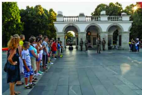
Przed Grobem Nieznanego Żołnierza

kompetencji kluczowych (tj. matematyki, informatyki i języka angielskiego) nastąpiło u 95 % uczestników projektu; podniesienie poziomu wiedzy o uwarunkowaniach i potrzebach lokalnego rynku pracy nastąpiło u 90% uczestników projektu, poziom wiedzy u uczniów na zajęciach dydaktyczno – wyrównawczych z matematyki wzrósł u 100 % uczniów. Wysiłek uczniów nie poszedł na marne, o czym świadczy wysoki przyrost wiedzy uczestników.