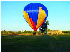
Największa atrakcja imprezy – loty balonem

W trakcie imprezy było wiele konkursów dla dzieci i młodzieży oraz dla tych trochę starszych. Najcenniejszą nagrodą był telewizor multimedialny, rozlosowany wśród zawodników, którzy mieli szczęście trafić z odległości 10 metrów w bramkę. Na zakończenie imprezy rozpoczęła się zabawa pod gwiazdami z zespołem Sweet Dreams.