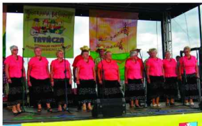
Zespół Śpiewaczy z Rożniatowa

W dniu 21 lipca 2013 r. Trynieckie Centrum Kultury w Tryńcy przy współorganizacji Centrum Kulturalnego w Przemyśle zorganizowało VII Regionalny Przegląd Piosenki Biesiadnej i Gawędy.