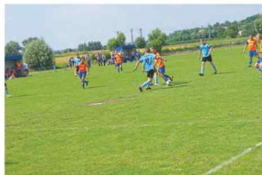
Mecz piłki nożnej