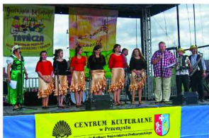
Młodzieżowy Zespół Śpiewaczy z Łapajówki

W przeglądzie uczestniczyło 24 zespoły biesiadne i 6 gawędziarzy. Naszą gminę reprezentowały zespoły z Maćkówki, Łapajówki oraz Rożniatowa.