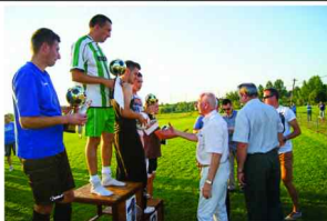
Dekoracja zwycięzców w piłce nożnej

Organizatorami imprezy byli: Wójt Gminy Zarzeczce, Gminna Rada Sportu, GOSiR Zarzeczce oraz Ludowy Klub Sportowy „Błękitni” Maćkówka.