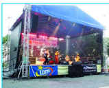
Biesiada z Radiem WAWA w 2013 roku

Na terenie gminy funkcjonuje 6 klubów sportowych oraz 5 szkolnych klubów sportowych. Kluby sportowe w Mackówsce i Żurawiczkach wzbogaciły się o nowe zaplecza socjalne, natomiast klub sportowy w Zarzeczcu korzysta ze stadionu na terenie GOSiR w Zarzeczcu. Ponadto powstało nowe boisko sportowe w Pelnatyczach, obecnie prowadzona jest modernizacja boiska w Roźniatowie. Gmina nasza należy do czołówek gmin w naszym województwie pod względem ilości i aktywności klubów sportowych.