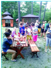
Grillowanie na Roztoczu.