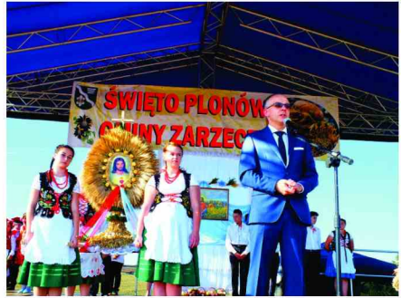
Przekazanie wieńca Przewodniczącemu Rady Gminy Zarzeczce

Nie zabrakło także tradycyjnych „przyśpiewek osetowych” – jednych pochwalono, innym wytknięto niedociągnięcia, ale z dozą humoru.