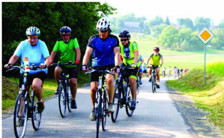
Uczestnicy w trakcie Rodzinnego Rajdu Rowerowego

Mamy nadzieję, że dzieci i młodzież, która skorzystała z różnych form wypoczynku jest zadowolona i miło spędziła czas.