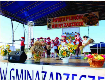
Młodzi artyści na scenie

Tradycyjny bochen chleba przekazali Wójtowi Gminy Zarzeczce, starostowie dożynek ze słowami: „Przyjmij ten bochen chleba upieczony uczciwie, chleba ten gospodarzu podziel sprawiedliwie”.