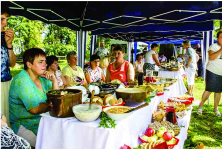
Suto zastawione stoły Pań z KGW

W trakcie imprezy na swoich stoiskach Panie z Kół Gospodyń Wiejskich z terenu Gminy Zarzezcze częstowały wszystkich pysznymi regionalnymi przysmakami specjalnie przygotowanymi na tę okoliczność. Swoje stoisko miał także Środowiskowy Dom Samopomocy z Łapajówki.