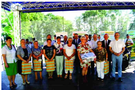
Nagrodzone Koła Gospodyń Wiejskich