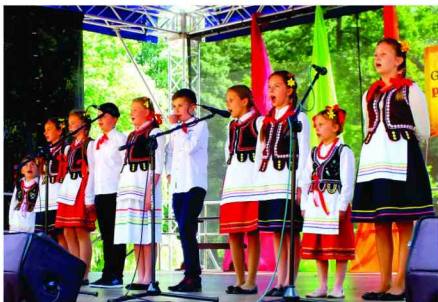
Występ Zespołu z Zarzeczca

Organizatorem imprezy byli: Centrum Kulturalne w Przemysłu, Wójt gminy Zarzeczce oraz Centrum Kultury w Zarzeczcu. Patronatem Honorowym objął przegląd Starosta Przeworski, a medialnym TVP Rzeszów, Ekspres Jarosławski, POD24info, Gazeta Jarosławska, Twoja TV, Serwis Regionalny Galicjusz.