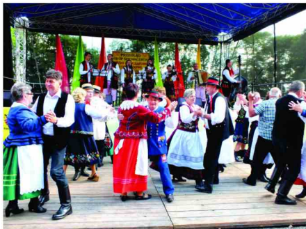
Wspólna zabawa z Zespołem Radomyślanie

W kategorii dzieci i młodzieży I miejsce i nagrodę pieniężną otrzymał Zespół Śpiewaczy przy Zespole Szkół w Zarzeczcu. Zespół ten został nominowany do udziału w XXIII Ogólnopolskim Festiwalu Folklorystycznej Twórczości Dziecięcej „Dziecko w Folklorze” w Baranowie Sandomierskim.