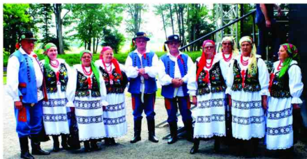
Zespół Śpiewaczy z Roźniatowa