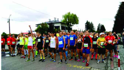
Uczestnicy Biegu na startcie