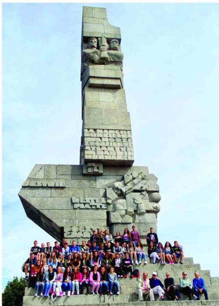
Pamiątkowe zdjęcie pod pomnikiem Westerplatte