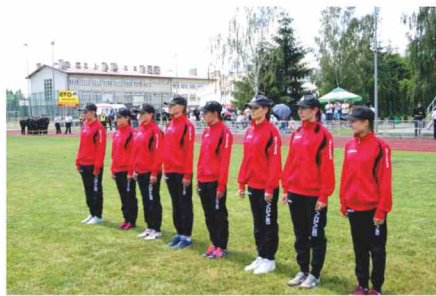
Zwycięska drużyna dziewczyn z Maćkówki

Uroczyste zakończenie zawodów, wręczenie dyplomów i pucharów nastąpiło podczas drugiej części imprezy pn. „Piknik Drobiowy – Promocja Mięsa Drobiowego”, która odbyła się w Zespole Pałacowo – Parkowym w Zarzeczcu.