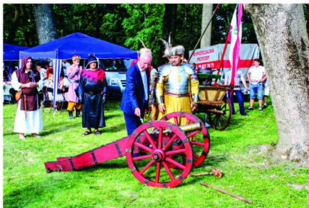
Oficjalne rozpoczęcie imprezy wystrzałem z armaty