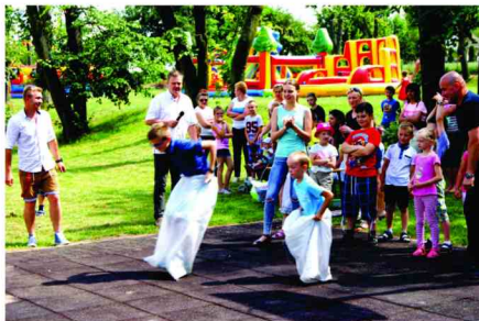
Bieg w workach w trakcie pikniku

również Koło Gospodyń Wiejskich oraz Ochotnicza Straż Pożarna w Roźniatowie.