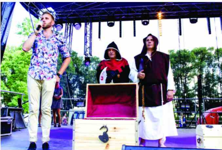
Licytacja przedmiotów na cele charytatywne

Uczestnicy wraz z opiekunami sprzedawali swoje wyroby, a na scenie zostały wylicytowane piękne dzieła wykonanie przez podopiecznych z Łapajówki. Zebrane pieniądze zostały przeznaczone na cele charytatywne. Firma Galicja na swoich stoiskach gastronomicznych i handlowych oferowała wiele produktów, a dzieci mogły pobawić się na placu zabaw.