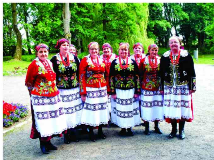
Zespół Śpiewaczy z Kiszielowa

W przeglądzie uczestniczyło 16 grup śpiewaczych dorosłych z pow. przemyskiego, leżajskiego, przeworskiego i jarosławskiego oraz jedna grupa śpiewacza młodzieżowa z Zarzeczca.