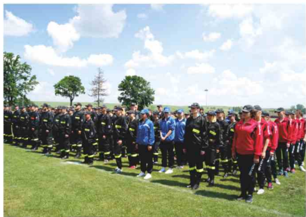
Zbiórka drużyn kobiecych i męskich

W zawodach wzięło udział 9 drużyn męskich z terenu Gminy Zarzezcze (Łapajówka, Maćkówka, Zarzezcze, Kisielów, Siennów, Zalesie, Pełnatycze, Roźniatów, Żurawiczki) oraz 4 drużyny kobiece (Maćkówka, Zalesie, Pełnatycze, Zarzezcze).