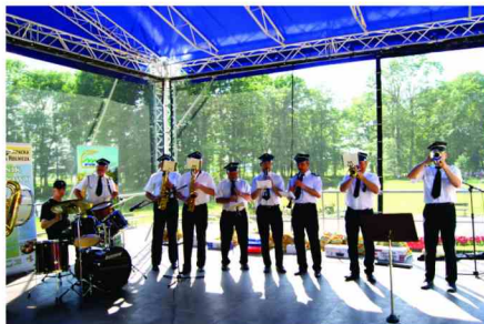
Występ Gminnej Orkiestry Dętej

Wielu wrażeń podczas imprezy dostarczył koncert Gminnej Strażackiej Orkiestry Dętej oraz występ Zespołu Mażorettek.