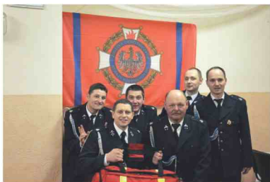
Strażacy OSP Maćkówka

Zarząd Gminny ZOSP RP, podsumowując kampanię sprawozdawczą stwierdził, że nastąpiła znaczna poprawa w zakresie gotowości bojowej OSP, na co składa się poprawa wyszkolenia strażaków oraz wyposażenie w sprzęt i umundurowanie.