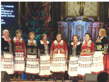
Występ Zespołu Śpiewaczego z Kisielowa

Zespołom gratulujemy i dziękujemy za rozślawianie naszej gminy.