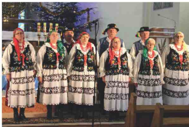
Zdobywcy I miejsca – Zespół Śpiewaczy z Roźniatowa

Naszą gminę reprezentowały trzy zespoły śpiewacze z: Maćkówki, Kisielowa i Roźniatowa. I miejsce zdobył Zespół Śpiewaczy z Roźniatowa, III miejsce zdobył Zespół Śpiewaczy z Kisielowa, Wyróżnienie zdobył Zespół Śpiewaczy z Maćkówki.