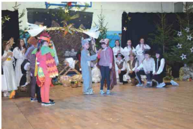
Jasełka w wykonaniu uczniów

w wykonaniu uczniów naszego gimnazjum. Świątyni dodał występ uczennic z kl. IV i V, które zatańczyły układ taneczny z szarfami. Na koniec części artystycznej wszyscy śpiewali polskie kolędy.