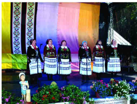
Występ Zespołu Śpiewaczego z Kisielowa