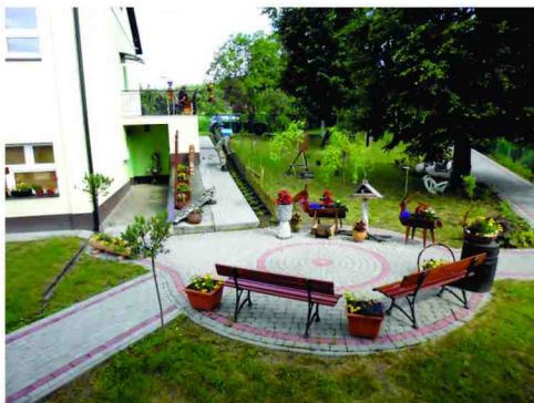
Ogródek przy budynku w Łapajówce

Środowiskowy Dom Samopomocy w Łapajówce jest filialnym ośrodkiem Środowiskowego Domu Samopomocy w Zalesiu. Jest to placówka pobytu dziennego dla osób starszych, niepełnosprawnych i samotnych, istniejąca od grudnia 2014 roku. Głównym celem ośrodka jest okazanie wsparcia w zakresie zwiększenia zaradności i samodzielności życiowej, a także integracji społecznej.