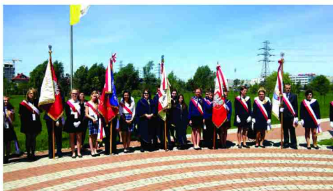
Pocztę sztandarową szkół im. Jana Pawła II

w postaci pysznych pierogów i papieskiej kremówki. Zjazd jest jedną z form współpracy Szkół noszących imię Jana Pawła II i pozwala integrować uczniów i nauczycieli z terenu województwa podkarpackiego.