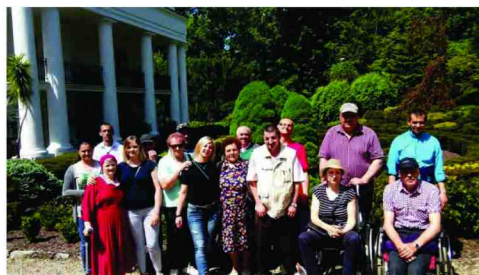
W trakcie zwiedzania Arboretum w Bolestraszcach

Wiosna to czas, w którym przyroda budzi się do życia. Po ponurej zimie nastaje pora spacerów i korzystania z pierwszych promieni słońca. Korzystając z uroków maja, uczestnicy ŚDS wraz z opiekunami wybrali się na wycieczkę do Arboretum w Bolestraszcach. Ciekawym doświadczeniem było zwiedzanie Ogrodu Sensualnego, przygotowanego specjalnie dla osób niepełnosprawnych i niewidomych, gdzie każdy zwiedzający miał możliwość dotknięcia każdej rośliny, poczucia jej zapachu czy zanurzenia rąk w chłodnej wodzie między liliami wodnymi. Pogoda sprzyjała podziwianiu piękna przyrody. Kwitnące kwiaty i krzewy rosnące pomiędzy ścieżkami i stawami intensywnie pachniały wiosną. Po wyczerpującym spacerze zostało zorganizowane ognisko i wspólne pieczenie kiełbasy.