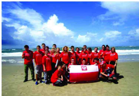
Uczestnicy praktyk w Portugalii

Efektom trzytygodniowego stażu było zdobycie dodatkowych kwalifikacji, przydatnych w zawodzie, potwierdzonych certyfikatem Intercultural Association Mobility Friendsale, również rozwój umiejętności pracy w zespole międzynarodowym oraz odkrywanie miejsc ważnych dla historii i kultury Portugalii.