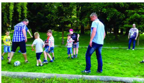
Tak było na Pikniku Rodzinnym w Przedszkolu