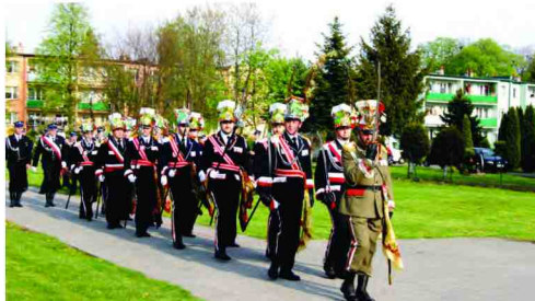
Straż Grobowa z Parafii Żurawiczki