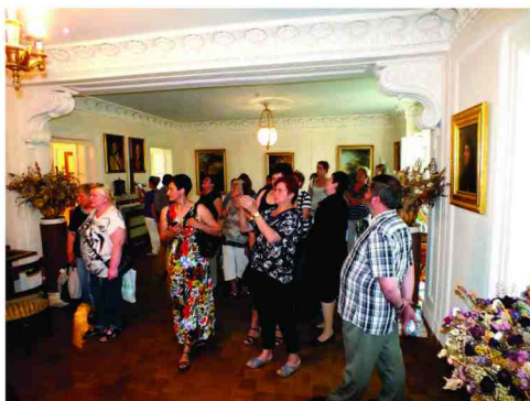
Turyści w trakcie zwiedzania muzeum