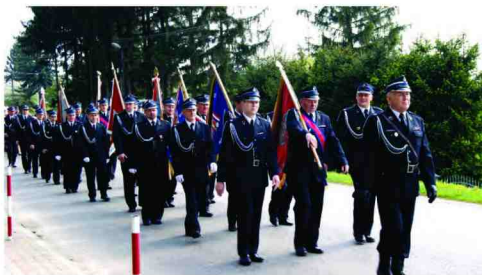
Poczty sztandarowe Ochotniczych Straży Pożarnych