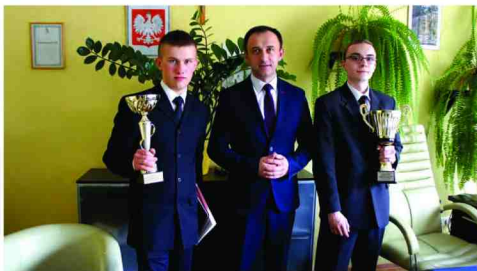
Dyrektor szkoły w gronie zwycięzców