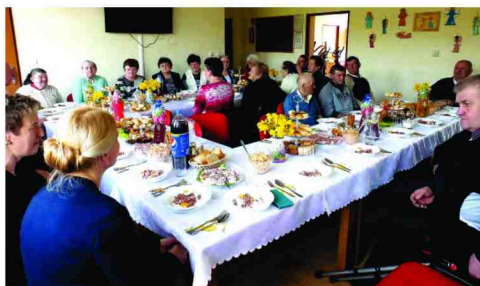
Uczestnicy ŚDS w trakcie śniadania wielkanocnego

Kwiecień przebiegał pod znakiem przygotowań do Świąt Wielkanocnych. W dniu 12 kwietnia, uczestnicy, pracownicy i zaproszeni goście zasiedli przy świątecznym stole. Tradycyjne potrawy oraz dekoracje wielkanocne zostały przygotowane przez uczestników i terapeutów ŚDS. Po części oficjalnej i modlitwie nastąpiło spożywanie przygotowanych na tę okoliczność potraw, wśród których nie zabrakło żurku, chrzanu, jajek i mazurków. Wszystkie podane zostały na pięknie, wiosennie udekorowanym stole. W ośrodku panowała ciepła, serdeczna i rodzinna atmosfera, niosąca optymizm i dająca siłę do pokonywania codziennych trosk i problemów.