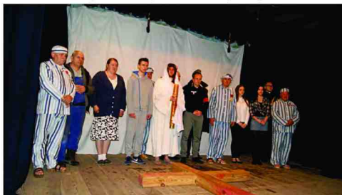
Aktorzy występujący w Misterium

Przedstawienie zmobilizowało widzów do chwili zadumy i refleksji nad własnym życiem i wiarą.