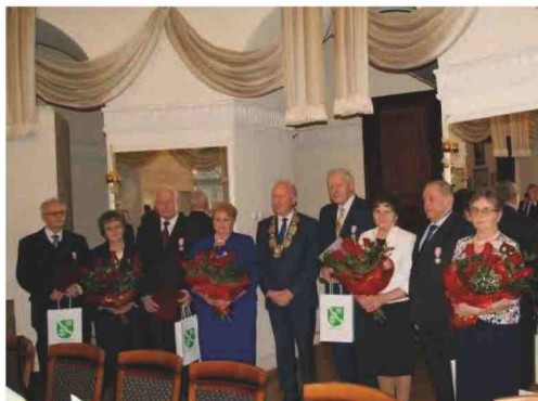
Uczestnicy uroczystości w pałacu w Zarzechu