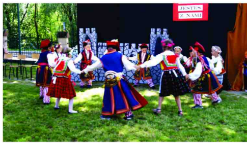
„Krakowiak” w wykonaniu uczniów z Maćkówki