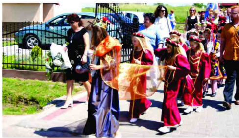
Wymarsz do kościoła na czele z Królową Jadwigą i dwórkami