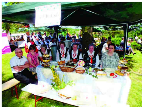
Stoisko Zespołu z Maćkówki

Wójt Gminy Zarzece, Centrum Kultury oraz Komitet Organizacyjny Dożynek zaprasza wszystkich do wzięcia udziału w Gminnym Święcie Plonów, które odbędzie się w dniu 20 sierpnia 2017 roku na placu przy remizie Ochotniczej Straży Pożarnej w Maćkówce.