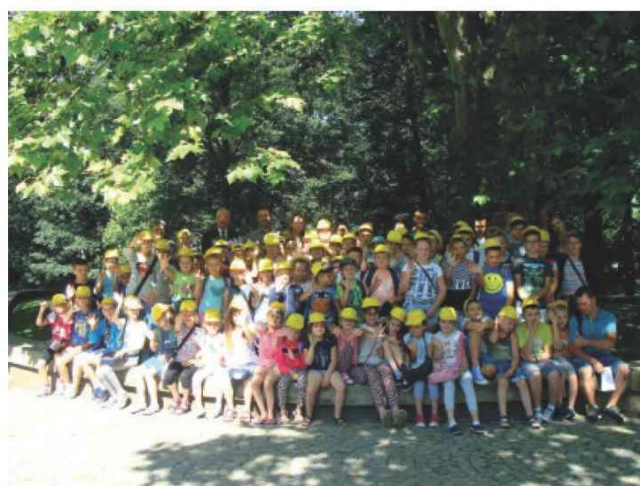
Pamiątkowe zdjęcia uczestników półkolonii