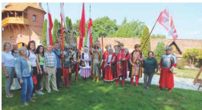
Delegacja z Ukrainy na Jarmarku Dominikańskim