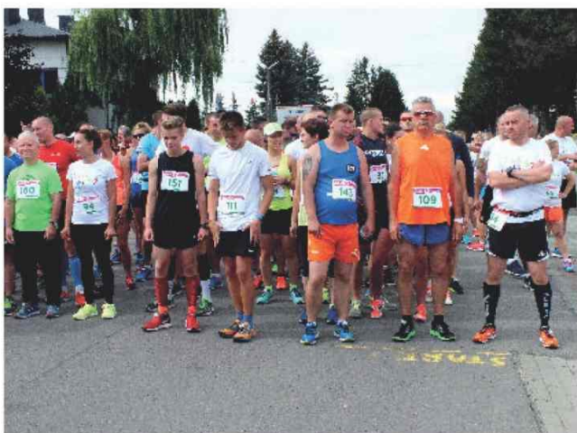
Uczestnicy III Biegu „Zarzeche na 5!” na starcie