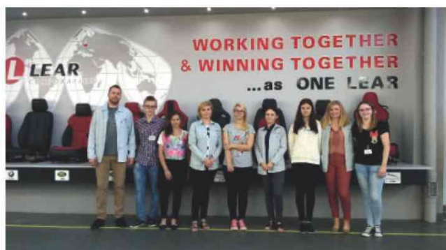
W trakcie stażu w LEAR w Jarosławiu

w Gniewczynie Trynieckiej, Carmel Club Caffè w Jarosławiu, Bar Smakosz i Restauracja Klasyczna w Jarosławiu, GPR Guma i Plastik Recycling w Zarzeczcu, Przedsiębiorstwo Produkcyjno Handlowe i Usług Wielobranżowych BaMał w Pełnatyczach, Lear Corporation w Jarosławiu oraz Zakład Odzieżowy Alex w Przeworsku. Wszystkim pracodawcom serdecznie dziękujemy!