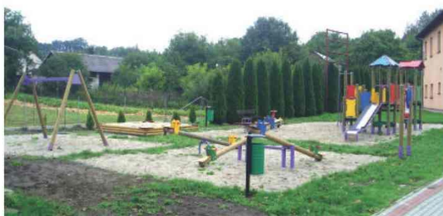
Nowy plac zabaw w Łapajówce

W ramach zadania wykonano także ogodzenie placu zabaw i boiska do siatkówki w Kisielowie oraz wybudowano nowe place zabaw w Łapajówce przy remizie OSP i w Maćkówce. Całkowita wartość projektu wyniosła 132 tys. zł.