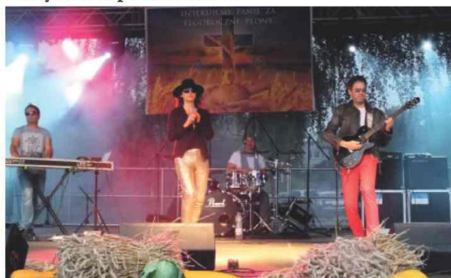
Występ Renaty Dąbkowskiej z grupą DYSTANS

Po części artystycznej na scenie wystąpiła gwiazda wieczoru - Renata Dąbkowska z zespołem Dystans. Zespół przypomniiał swoje największe przeboje lat dziewięćdziesiątych, m.in. „Czerwona jarzębina”, „Co za noc”, „Zaczekaj z tym do jutra”. Po koncercie uczestnicy bawili się do późnych godzin nocnych z zespołem The Five.