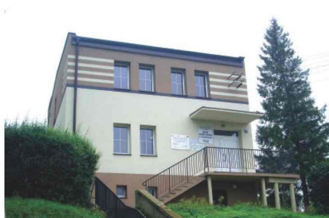
Zmodernizowany budynek Ośrodka Zdrowia w Żurawczkach