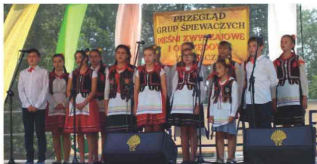
Występ Młodzieżowego Zespołu Śpiewaczego z Zarzeczca

Patronat medialny nad imprezą objęli: TVP Rzeszów, Twoja TV, Gazeta Jarosławska, Express Jarosławski i Galicjusz.pl.