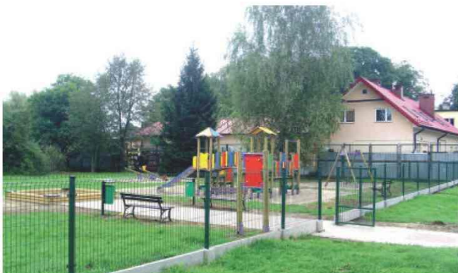
Zmodernizowany plac zabaw w Zarzeczcu

W ramach zadania wykonano także ogodzenie placu zabaw i boiska do siatkówki w Kisielowie oraz wybudowano nowe place zabaw w Łapajówce przy remizie OSP i w Maćkówce. Całkowita wartość projektu wyniosła 132 tys. zł.