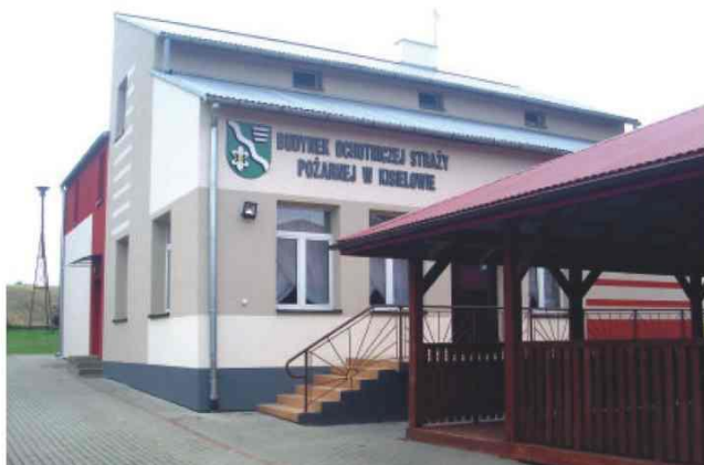
Budynek OSP w Kisielowie po modernizacji

Systemem gospodarczym, przy pomocy Brygady Remontowo-Budowlanej przy Urzędzie Gminy, realizowane są roboty wykończeniowe rozbudowanej części remizy OSP w Zarzeczcu, jak również bieżące remonty w pozostałych budynkach OSP.