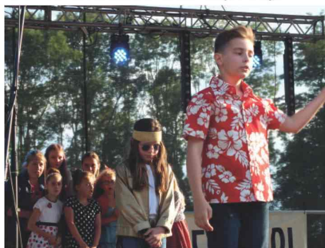
Grupa młodych aktorów w trakcie przedstawienia