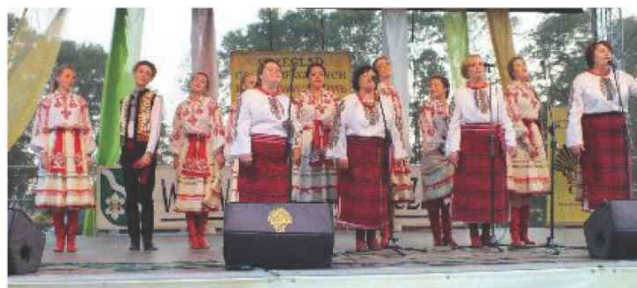
Występ zespołów z Ukrainy