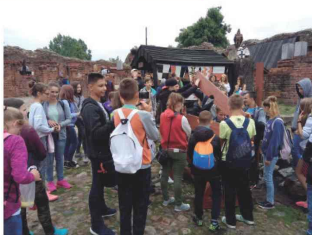
Uczestnicy kolonii w Gąsawie

Ośrodek kolonijny znajdował się niedaleko jeziora Gąsawskiego, więc uczestnicy kolonii codziennie mogli korzystać z uroków pobytu nad wodą. W programie kolonii było wiele atrakcji m. in. wycieczka do Poznania, gdzie uczestnicy kolonii mieli możliwość zwiedzić Rynek Poznański, Katedrę oraz Muzeum Narodowe.