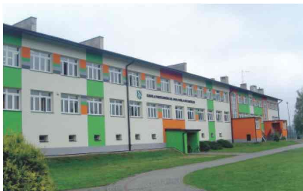
Zmodernizowany budynek Zespołu Szkół w Zarzeczcu