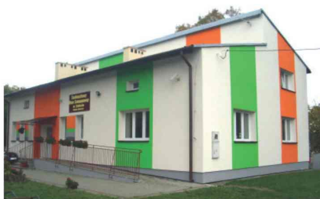
Zmodernizowany budynek Środowiskowego Domu Samopomocy w Zalesiu