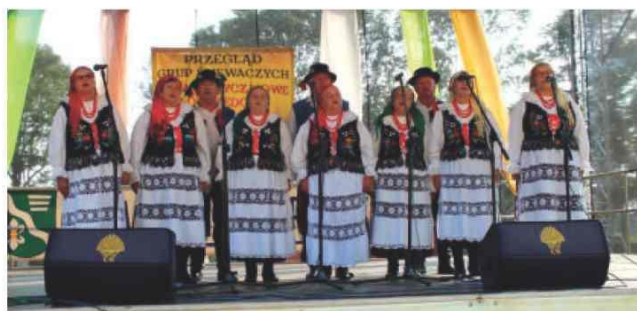
Występ Zespołu Śpiewaczego z Roźniatowa