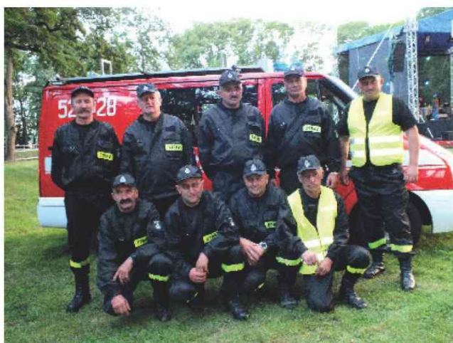
Zwycięzca drużyna strażaków z Zalesia

W ramach ćwiczeń musieli zaliczyć konkurencje takie jak: gaszenie pragnienia z butelki, slalom z poszkodowanym, opatrzenie rannego, wbijanie gwoździ, rzut do celu oraz zrywanie jabłek. Najlepszą jednostką była drużyna strażaków z Zalesia.