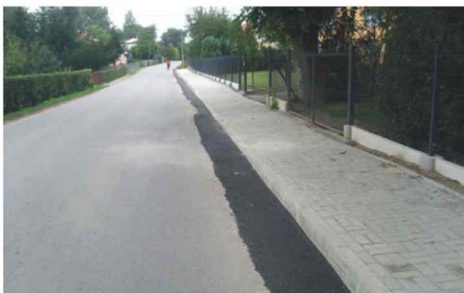
Wybudowany chodnik wraz z nowymi ogrodzeniami przy drodze powiatowej w Zarzeczcu w stronę Łapajówki

Również i w tym roku nie brakuje nowych odcinków chodników oraz przebudowanych dróg. Na podstawie porozumienia z Powiatem Przeworskim zmodernizowano chodnik „do wsi” w Roźniatowie oraz wybudowano ciąg dalszy chodnika w Zarzeczcu w kierunku Łapajówki.