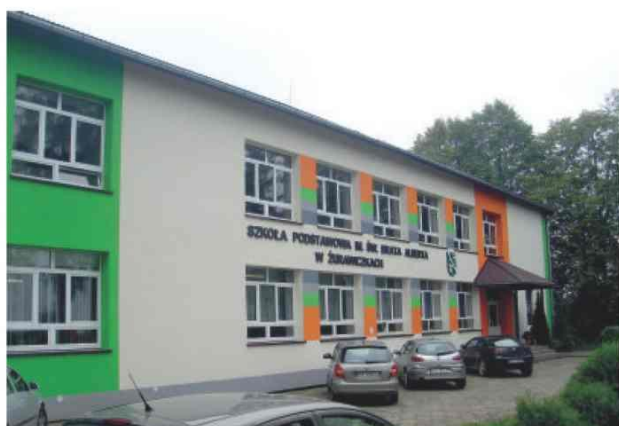
Zmodernizowana Szkoła Podstawowa im. Brata Alberta w Żurawczkach