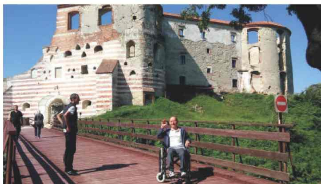
Zwiedzanie ruin zamku w Janowcu

W sierpniu nasi uczestnicy przez trzy tygodnie pozostawali w swoich rodzinnych domach, wracając po takiej przerwie mieliśmy wszyscy wiele sobie do opowiadania i przeżywania. Każdy z uczestników tęsknił za tymi murami, a przede wszystkim za swoimi przyjaciółmi z Ośrodka. 30-31 sierpnia byliśmy na wyjazdowej wycieczce w Kazimierzu Dolnym i w Nałęczowie. W pierwszym dniu zaplanowany był rejs po Wiśle, dla niektórych było to pierwsze w życiu doświadczenie. Zwiedziliśmy ruiny Zamku w Janowcu, gdzie według legendy krąży Czarna Dama... Niestety, nam jednak się nie ukazała... Pozostało nam zrobić na dowód, że istniała, zdjęcie jej figury.