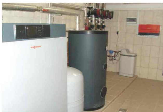
Nowa kotłownia na paliwo gazowe w Szkole Podstawowej w Żurawczkach