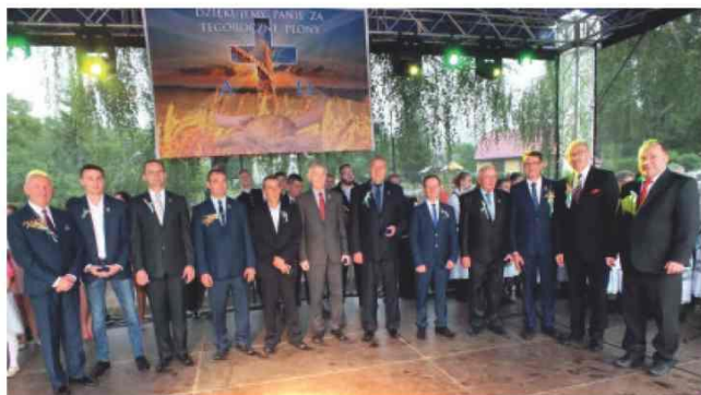
Nagrodzeni rolnicy z terenu naszej gminy