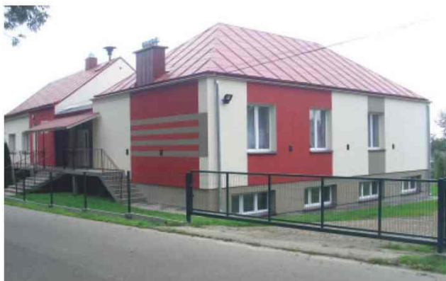
Remiza OSP w Maćkówce po kapitalnym remoncie