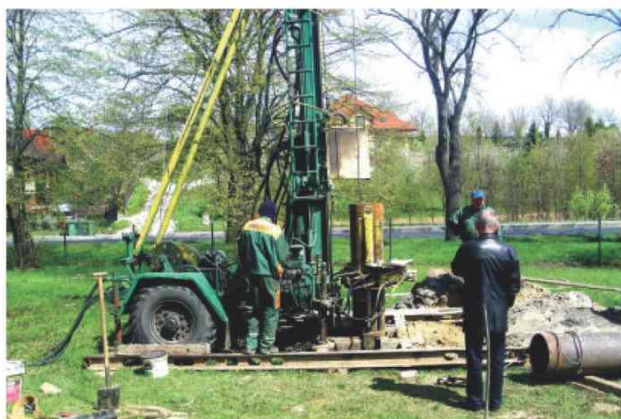
Prace geologiczne podczas wiercenia studni S-1A na terenie SUW w Zarzeczcu

W miesiącu czerwcu zakończono budowę studni wiarconej S-1A na terenie Stacji Uzdatniania Wody w Zarzeczcu. Studnie o głębokości 32m i wydajności 30 m 3 /h wykonała specjalistyczna firma geologiczna „Hydrogeopol” z Dębicy. Inwestycja finansowana była w całości w budżecie gminy i wyniosła 122 tys. zł.