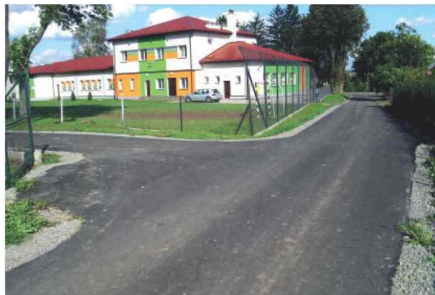
Przebudowana droga gminna k/szkoły oraz zmodernizowany budynek Szkoły Filialnej im. Orła Białego w Pełnatyczach.

Ze środków współfinansowanych w ramach Lokalnej Grupy Działania „Dorzecze Mleczki” wykonano drogi w miejscowościach Pełnatyczach (2 odcinki), Zalesie i Siennów. Wartość robót wyniosła 187 tys. zł. z czego dofinansowanie wyniosło 118 tys. zł.