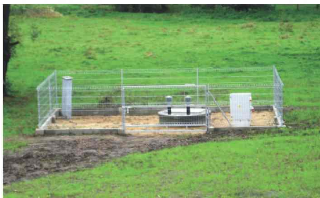
Przepompownia ścieków w Maćkówce po pracach remontowych.

W miejscowości Maćkówka dokonano wymiany najważniejszej przepompowni ścieków. Zakres robót obejmował wymianę zbiornika, uzbrojenia, zasilania elektrycznego i sygnalizacji pracy przepompowni. Wykonano również nowe ogrodzenie. Całość inwestycji wyniosła 65 tys. zł.