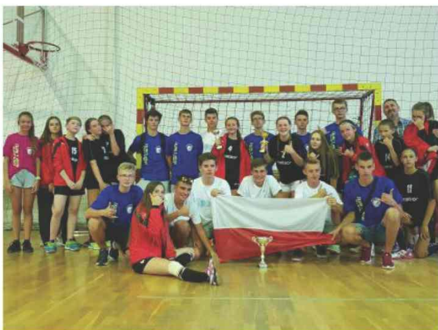
Pamiątkowe zdjęcie z Macedonii

W dniach od 4 do 12 września br. grupa piłkarzy i piłkarek ręcznych z Zarzeczca, Przeworska i Lublina brała udział w I Turnieju Piłki Ręcznej rozgrywanym w okazji Święta Narodowego Macedonii w Kicevo.