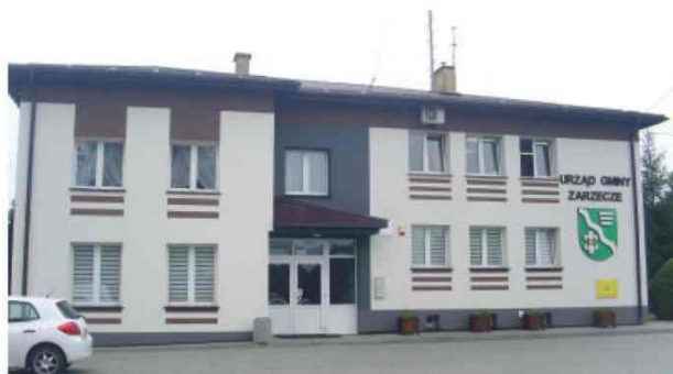
Budynek Urzędu Gminy po robotach modernizacyjnych

inwestycji wyniósł 3,2 mln zł. Zadanie zostało dofinansowane w kwocie 2.550 tys. złotych ze środków Marszałka Województwa Podkarpackiego w ramach Osi Priorytetowej nr III Czysta energia, działanie 3.2 Modernizacja energetyczna budynków RPO WP na lata 2014-2020.