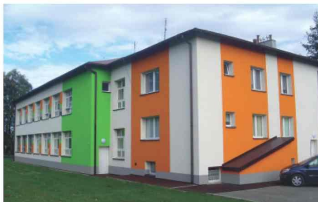
Zmodernizowana Szkoła Filialna im. Stefana Kardynała Wyszyńskiego w Roźniatowie