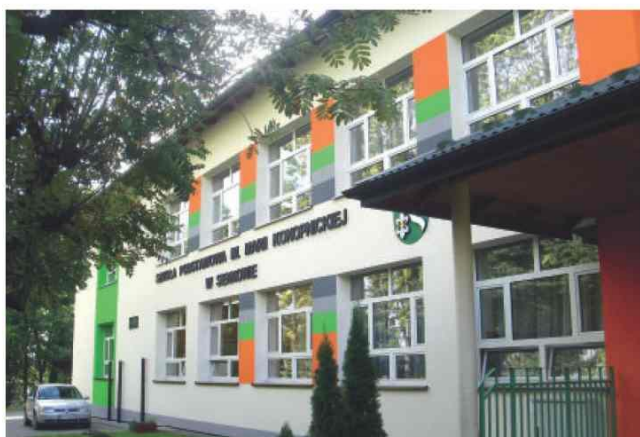
Zmodernizowana Szkoła Podstawowa im. Marii Konopnickiej w Siennowie