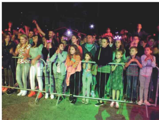
Licznie zgromadzona publiczność w trakcie koncertu

Największą atrakcją Dni Gminy był występ Radka Liszewskiego z grupą Weekend, która wykonała swoje największe przeboje: „Ona tańczy dla mnie”, „Za każdą chwilę”, „Za miłość mą” oraz wiele innych. Po godzinnym koncercie rozpoczęła się zabawa pod gwiazdami z zespołem The Five.