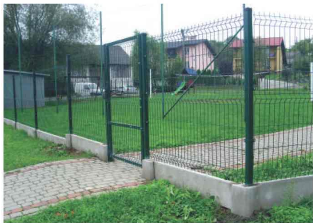
Ogrodzenie terenu rekreacyjnego w Kisielowie

W zakresie infrastruktury sportowej wybudowano nowe trybuny sportowe na stadionie sportowym w Roźniatowie i Żurawiczkach.