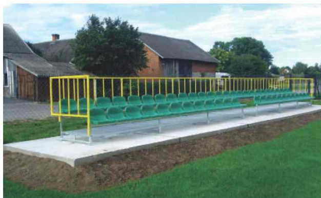
Trybuny sportowe na stadionie sportowym w Roźniatowie

W zakresie infrastruktury sportowej wybudowano nowe trybuny sportowe na stadionie sportowym w Roźniatowie i Żurawiczkach.