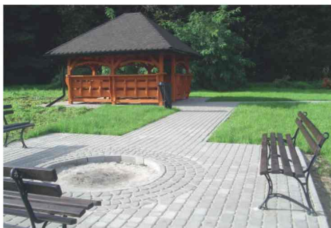
Teren rekreacyjno-wypoczynkowy w Siennowie

W Siennowie w ramach zagospodarowania działki gminnej w pobliżu remizy OSP i amfiteatru urządzono zabudowę rekreacyjną w formie altany wraz z deptakami i paleniskiem. Całość obiektu jest ogólnodostępna. Zdanie realizowane zostało w całości z budżetu gminy i wyniosło 22 tys. zł.