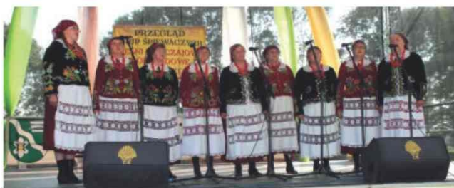
Występ Zespołu Śpiewaczego z Kisielowa